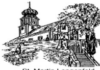
St. Martin Lengelfeld