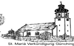
St. Mariä Verkündigung Günching